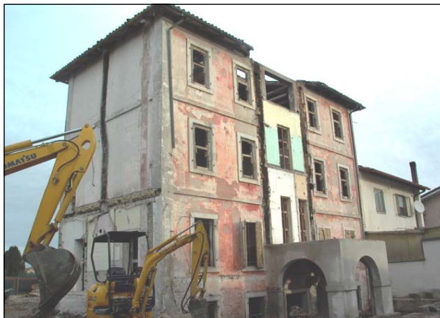
Inizio lavori (vista dal retro).