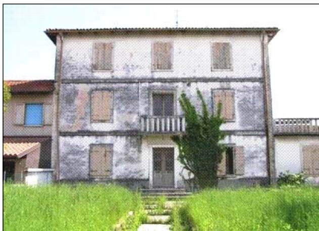
La facciata prima dei lavori di restauro.