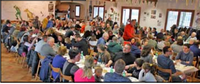
5° Pranzo di Primavera del Noce

sarsi per due persone. Ringraziamo i 21 sponsor, le persone che hanno acquistato i 7589 biglietti e tutti coloro che ci hanno aiutato a venderli.