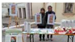
10.12.2017: San Vito al Tagliamento