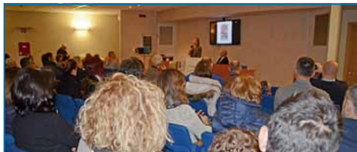
La dott.ssa Fabia Mellina Bares, Garante regionale dell'infanzia

Le opere del "Concorso per illustratori" saranno esposte in una mostra alla prossima Sagra del Vino di Casarsa.