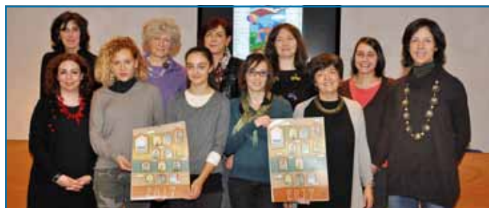
Le autrici delle opere pubblicate nel Calendario 2017